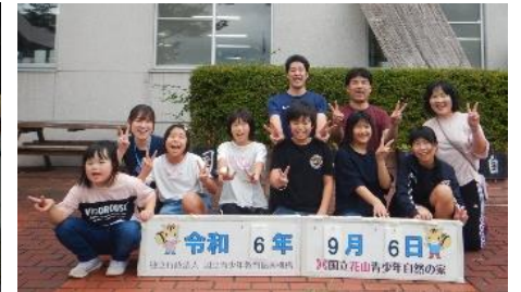
「充実した3日間に満足の笑顔」