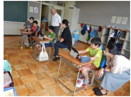
「3・4年生 自由参観 学活」

閉校記念事業説明会では、保護者の皆様のご了承を得て、閉校記念事業実行委員会を設置することができました。来年度の閉校に向けて、保護者の皆様のお力添えをどうぞよろしくお願い申し上げます。