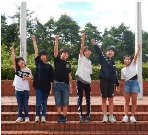
「力強くエイエイオー!」

9/4(水)~9/6(金)の2泊3日で、5・6年生が国立花山青少年自然の家にて宿泊学習を行ってきました。活動全てにおいて、友達と協力し、力を合わせて乗り越え、支え合うよさを実感することができました。