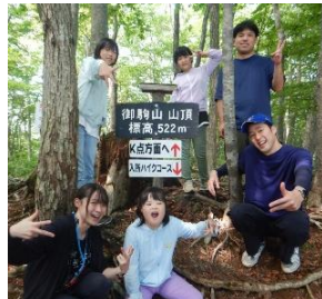
「御駒山の頂上にて」